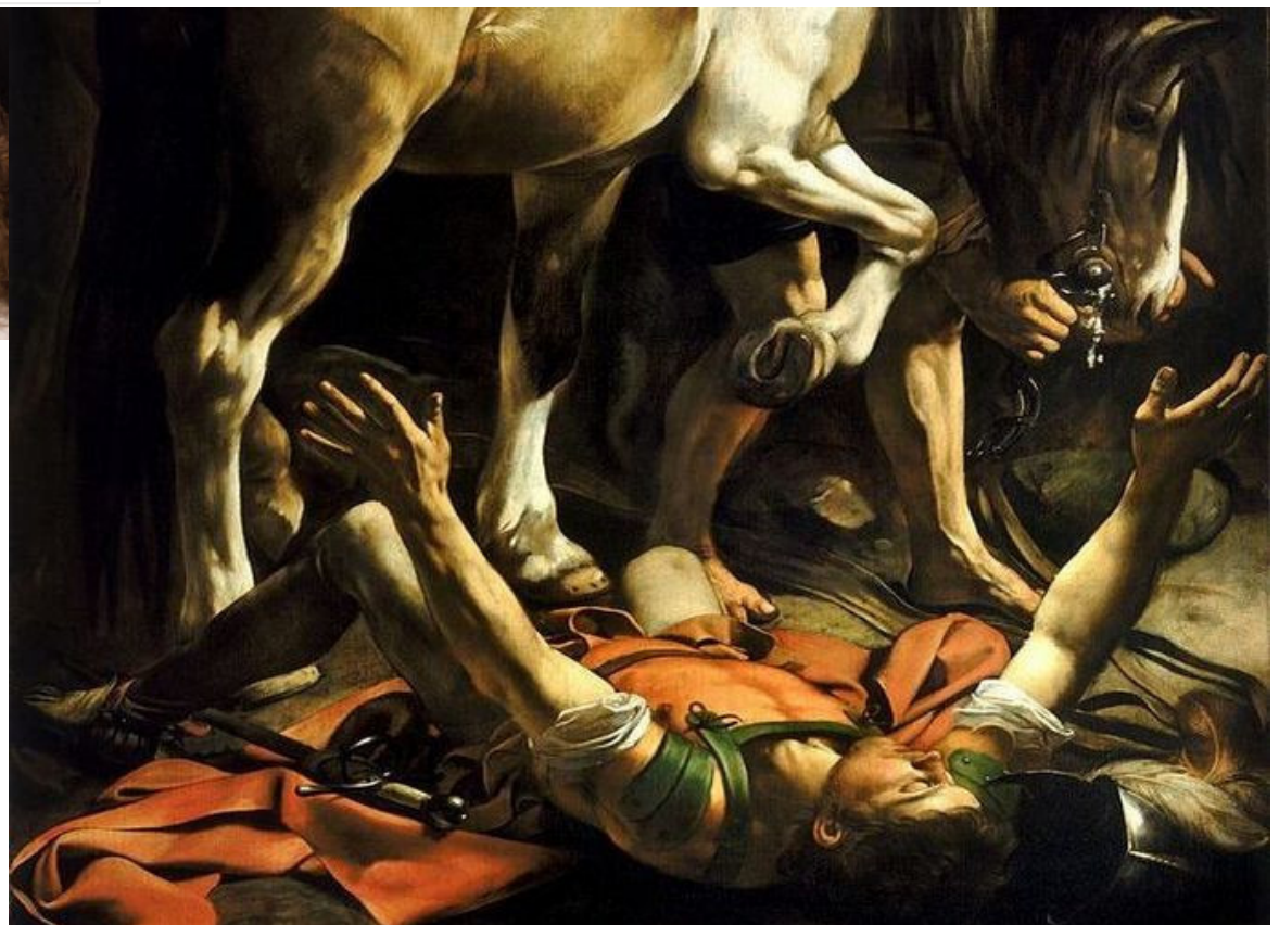
Michelangelo Merisi, La conversione di Paolo , Roma – Santa Maria del Popolo