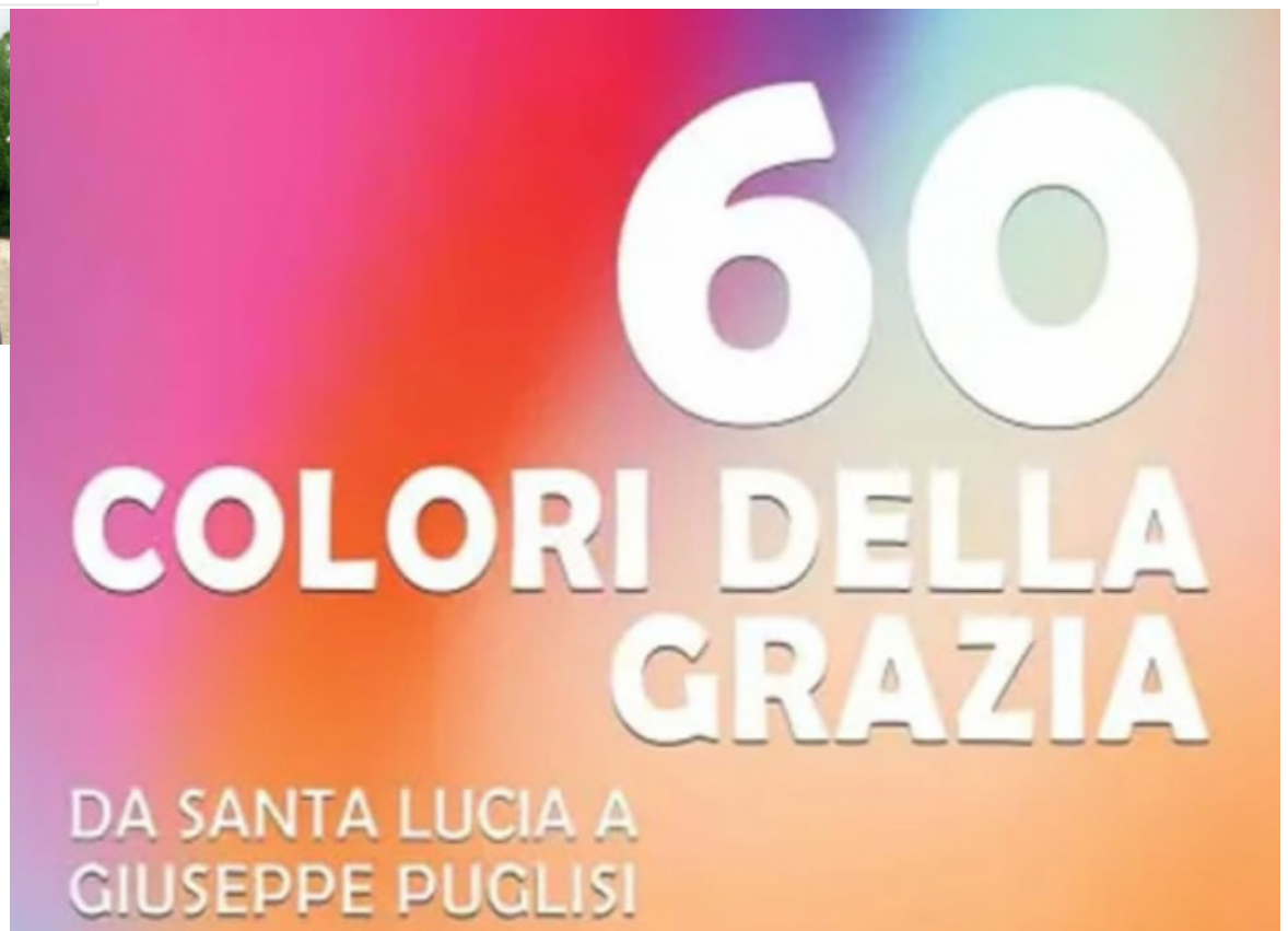
Figure note da riscoprire e presenze più modeste e nascoste da conoscere, anche attraverso riferimenti all'arte, alla letteratura e alla musica. Sono questi i santi ritratti da Antonio Tarallo, firma nota ai lettori della Nuova Bussola , nel suo 60 colori della grazia (Ares 2024, pp. 188), una galleria di testimoni luminosi del Cristo, ciascuno dei quali ha attuato esemplarmente il proprio carisma, e dunque una sfumatura puntuale e