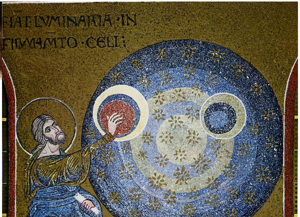
Particolare del Ciclo della Creazione - Monreale, Cattedrale di Santa Maria Nuova